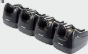
▪ 94A150037 Puits chargeur 4 positions ▪ 94A150038 Puits Ethernet 4 positions